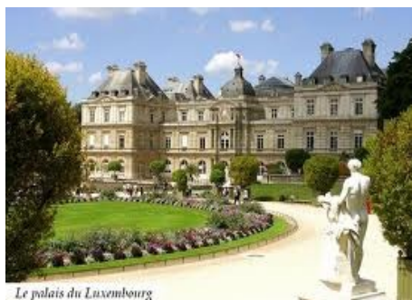
Le palais du Luxembourg